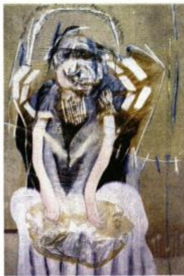
Zbilja zakrpe prijanja samo uz kvačice, 1998.

Njezino slikarstvo odvija se u kadrovima i sekvencama; može ispričati cijeli film u jednom kadru (slici) komprimiranog značenja. Koliko je njezino slikarstvo lirsko i poetično, puno suosjećanja, toliko je i epsko,